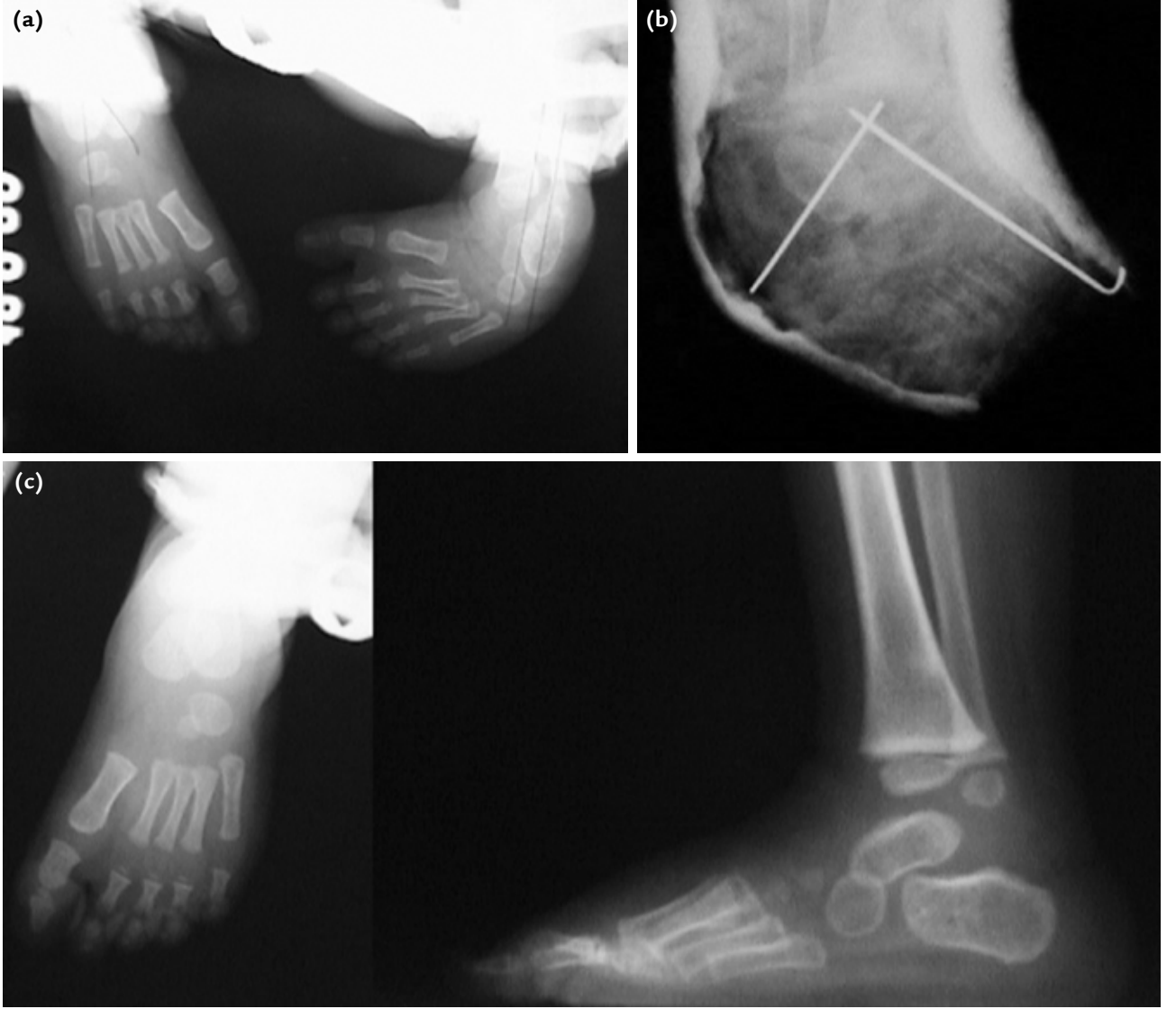
Şekil 4 a–c. Doğuştan çarpık ayaklı bir olgunun ameliyat öncesi (a), erken ameliyat sonrası (b) ve kontrol (c) röntgenleri.