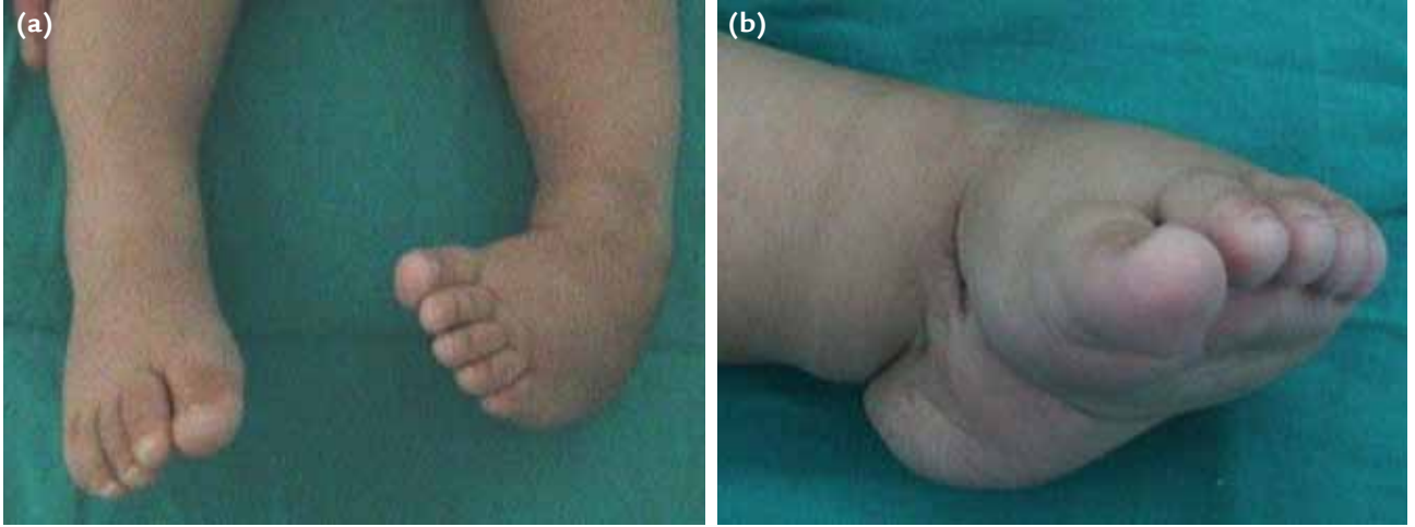
Şekil 1. a, b. Doğuştan çarpık ayak deformitesinin klasik görüntüleri.