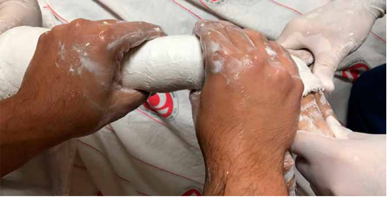
Şekil 2. Şekillendirme ( mold ).