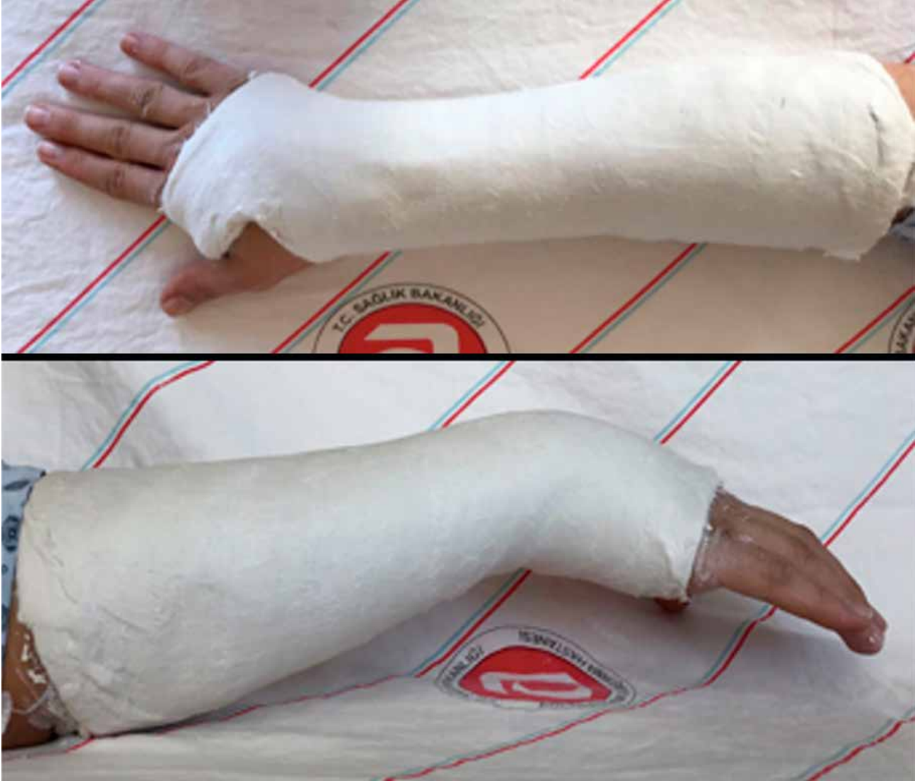
Şekil 3. Radius distal uç kırıklarında alçılama.

Lokal, bölgesel veya genel anestezi ile önce uygun ağrı kontrolü yapılır. Lokal hematoma bloğu, ciddi şişliği olmayan düşük enerjili kırıklarda tercih edilir. Zor redukte edilecek kırıklarda, geç redüksiyonlarda, kaymış kırıkların yeni redüksiyon manevralarında ve ödem, kontüzyon, açık yara gibi lokal yumuşak doku sorunu olanlarda, aksiller blok anestezisi gibi bölgesel anestezi tercih edilir.