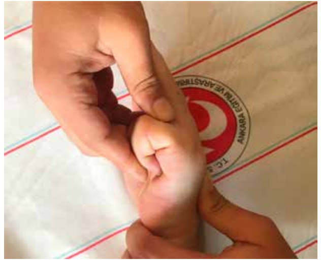
Şekil 7. Jahss manevrası.

Kapalı olarak düzeltilemeyen veya düzgün hali korunamayan kırıklar, çoklu metakarp kırıkları, eklem içi kırıklar, kabul edilen değerlerin üzerinde açılanma gösteren kırıklar (boyun kırıklarında: 2. ve 3. metakarp için 15°, 4. metakarp için 40°, 5. metakarp için 60° ve üzeri açılanma) ile rotasyonel deformite varlığı, cerrahi tedavi için bilinen endikasyonlardır ve sporcular için de geçerlidir. [55] Dördüncü ve 5. karpometakarpal eklemler daha hareketli olduğu için, 4. ve 5. parmaklar açılanmayı daha iyi tolere eder. Bazı yazarlar 70°'ye kadar açılanmayı kabul etse de, 30° üzerindeki açılanmalar