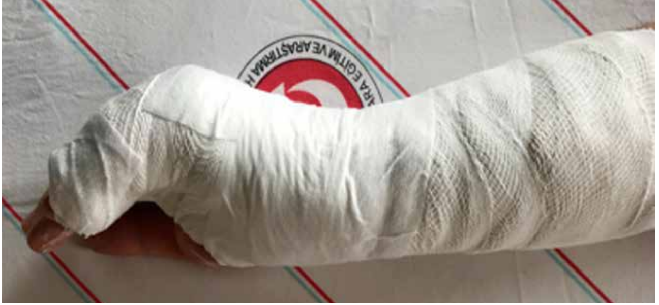
Şekil 8. Boxer alçısı.

Ortalama üç hafta sonunda atel çıkarılır ve parmak egzersizlerine başlanır. Günlük uygulamada en çok rastlanan sorun, ekstansiyonda redüksiyon ve MF eklem tam ekstansiyonda atellemedir. Bu tip tespit, MF eklemlerde kollateral bağ kontraktürüne ve MF eklem sertliğine yol açar. Ancak Hofmeister, atel uygulamasında MF eklem ekstansiyonda veya fleksiyonda olmasının fonksiyonel sonuçlarda bir fark yaratmadığını göstermiştir. [58] Poolman ise, Cochrane derlemelerini gözden geçirmiş ve herhangi bir atelleme protokolünün üstünlüğünü gösterememiştir. [59] Tedavi yöntemi-ne bağlı olmaksızın, olgularda üçüncü ay sonundaki fonksiyonel sonuçlar aslında benzerdir. [60]