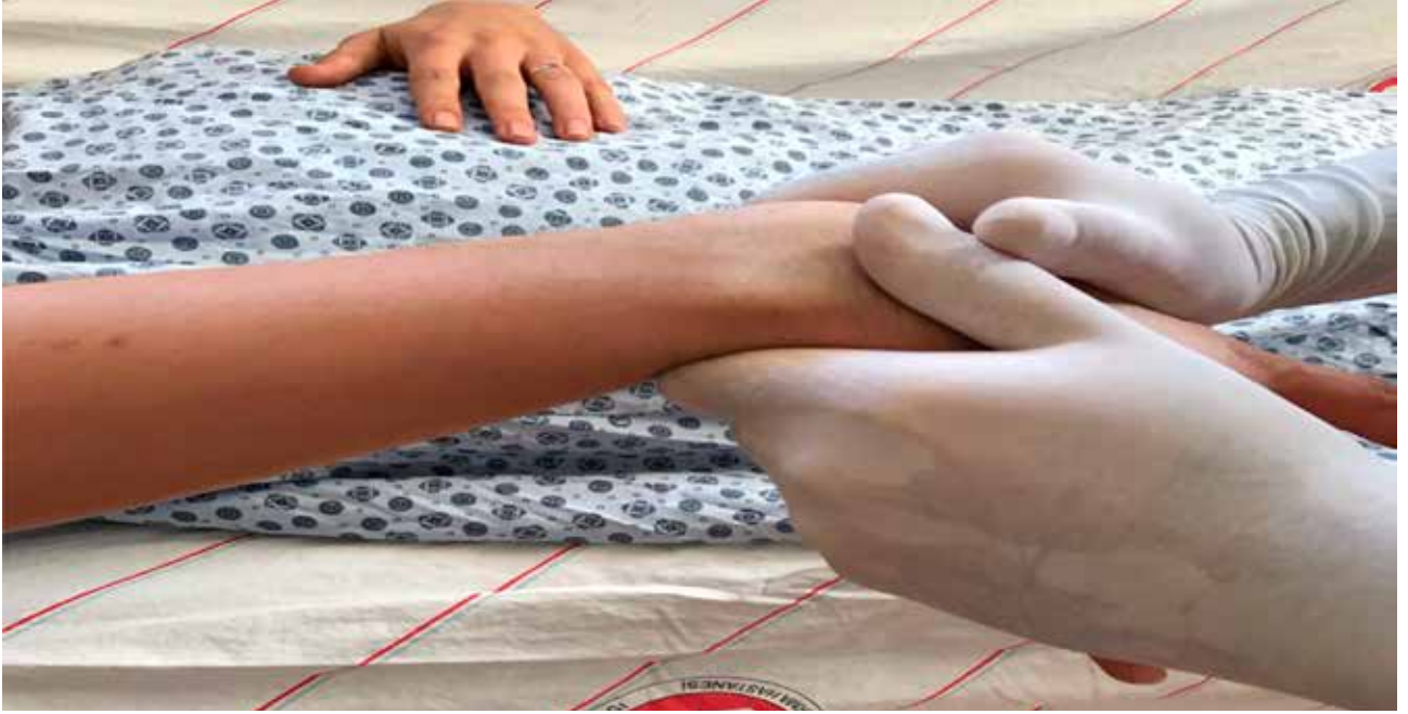
Şekil 1. Distal parçanın dorsale açıldığı radius distal uç kırığı redüksiyon manevrası: doğrusal çekme sonrası distal parça fleksiyon ve ulnar deviyasyona getirilir.

önceki ve sonraki kemik boyunca, eklem dışı kırıklarda ise bir önceki ve bir sonraki eklemi sabitleyecek şekilde alçı yapmak gereklidir. Ancak, radius distal uç kırıklarında dirsek altı alçıların en az dirsek üstü olanlar kadar etkin olduğuna dair çalışmalar vardır. [1,2]