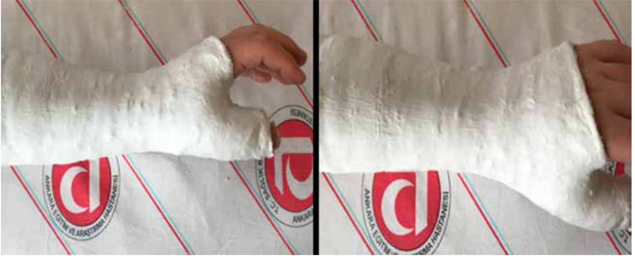
Şekil 6. Skafoid alçısı.