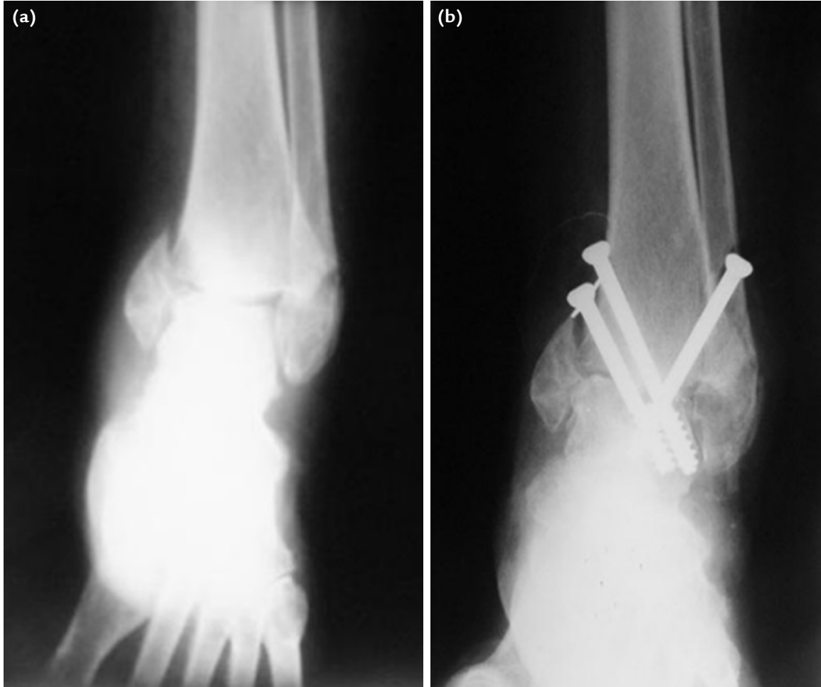
Şekil 3. a, b. Başarısız tedavi ve kaynamama sonrası gelişen osteoartrit (a). Ayak bileği artrodezi ile osteoartrit tedavisi (b).