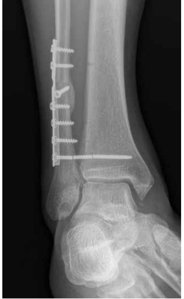
Şekil 1. Sindezmoz vidasında kırılma.

Sindezmoz vidasının yerleşimi, büyüklüğü, sayısı ve çıkarılma durumu da komplikasyonlara yol açabilir. Ekleme 2 cm mesafede ve 4 cm'den daha proksimal yerleştirilen sindezmoz vidalarının, peroneal arterin perforan dalını yaralama, dolayısıyla sindezmotik bölge iyileşmesini bozma riski vardır. [18] Sindezmoz tespiti için konulan vidalar, tercihe göre, ameliyat sonrası üçüncü aydan sonra çıkarılabilir. Sindezmotik vidalar çıkarılmaz, yerinde bırakılır ise kırılabilir (Şekil 1). Bu durum fonksiyonel bir sorun teşkil etmemesine rağmen, hastaların bir kısmı psikolojik olarak rahatsız olurlar.