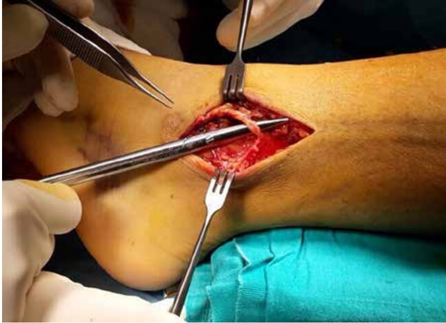
Şekil 4. Süperfisiyel peroneal sinirin lateral yaklaşım sırasında ortaya konulması.