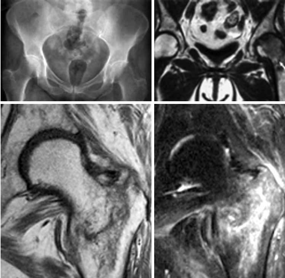
Şekil 5. Femur boyun kırığı.

Maisonneuve kırığı, proksimal fibula kırığı ile birlikte iç malleol kırığı ya da deltoid bağ yaralanmasının birlikte görülmesidir. Ayak bileği travmalarında mutlaka proksimal fibulada bir patoloji olup olmadığına bakılmalıdır.