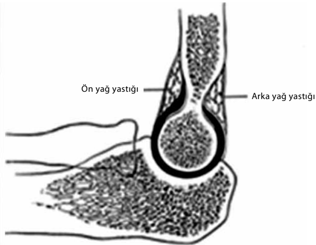
Şekil 1. Pozitif yağ yastığı bulgusu.