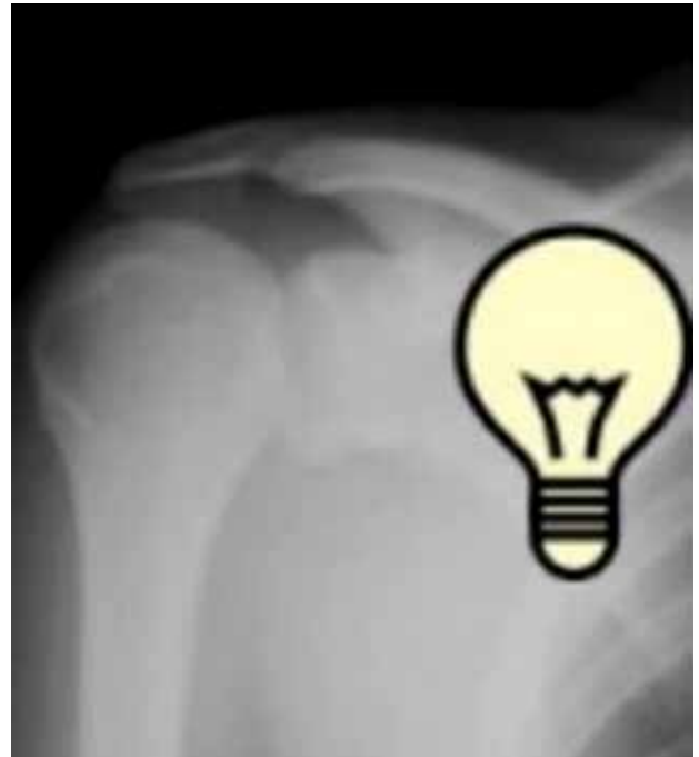
Şekil 4. Arkaya omuz çıkığında proksimal humerusun ampul şeklinde görülmesi.

Bikondiler Hoffa kırığı çok nadir görülür. Literatüre bakıldığında sekiz olgu bildirilmiştir. Ön-arka grafilerde süperpozisyonun dolaylı görülmesi zor olabilir. Eğer