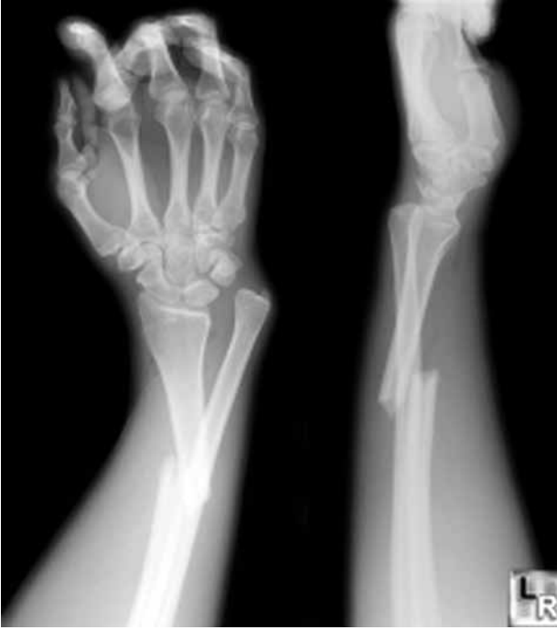
Şekil 2. Galeazzi kırıklı çıkığı.

grafi yardımcı olabilir. Şüphelenilen hastalarda tekrar değerlendirme yapılması gereklidir. [9,10]