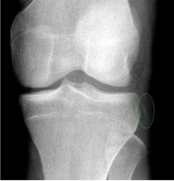
Şekil 6. Segond kırığı.

Lisfrank kırığı çok nadirdir ve bütün ortopedik travmaların %1'den azında görülür. Yaklaşık %20 olguda acil serviste ilk değerlendirmede atlanır. [17] Eğer tanı konulamaz ise kronik ağrı ile birlikte fonksiyonel kayıp riski yüksektir. Hasta farklı şekillerde başvurabilir. Akut safhada hasta ayağının üstüne basabilir ancak Lisfrank eklemi boyunca hassasiyet vardır. Ayak arkası sabitlendikten sonra ayak önü pasif pronasyon ile birlikte abduksiyona getirildiğinde ağrı ortaya çıkar. Bu manevra tarsometatarsal yaralanmalar için spesifiktir. Ayağın plantar kesiminde ekimoz görülebilir (Şekil 7). Genişlemiş ayak veya patolojik hareket açıklığı şiddetli kırıklı çıkığı işaret eder. Şiddetli kırıklı çıkık durumunda ayak bileği seviyesinde, sıklıkla posteriyor tibial arter olmak üzere vasküler spazm görülebilir. Tanı, yük verir pozisyonda iken üç yönlü grafi ile konulabilir, gerekirse diğer ayak ile karşılaştırmalı grafi çekilmelidir. Normal ön-arka ve oblik grafide 2. metatarsın bazisi-