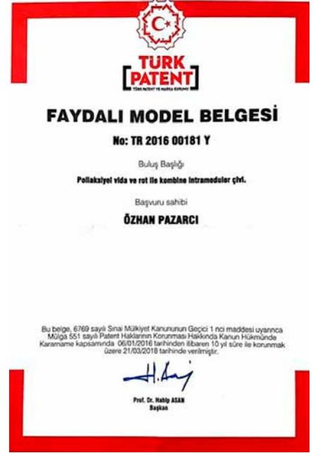
Şekil 3. Faydalı model belgesi.