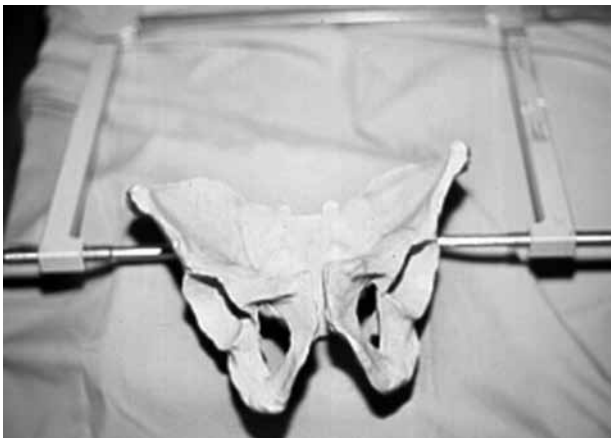
Şekil 3. Pelvik klempe.

kompleksin stabilizasyonunu yeterince sağlayamazsa bu gibi durumlarda Ganz'ın anti-şok pelvis fiksatorü kullanılabilir (C klempe). [4] Ganz fiksatorü sakroiliyak eklem üzerinden perkütan pinler yardımıyla uygulanarak posteriyor stabilizasyona yardımcı olur (Şekil 3). Acil müdahale kapsamında eksternal fiksator uygulanan hastalarda morbidite ve mortalite önemli oranda azalmaktadır. Riemer ve ark. [7] da 605 hastalı çalışmalarında bunu bildirmişlerdir. Vertikal yönde stabil olmayan pelvis kırıklarında asıl cerrahi uygulanana kadar eksternal fiksatöre ek olarak distal femurdan iskelet traksiyonu uygulanması yararlı olmaktadır. [8] Pelvis kırıklarında eksternal fiksator uygulamaları acil müdahalenin vazgeçilmezlerinden olmasına rağmen geçici çözümler olup kan kaybını sınırlayarak hasta stabilizasyonunu sağlama ve uygun cerrahi müdahale yapılana kadar zaman kazandırma gibi yararları vardır. Eksternal tespit yöntemlerine rağmen kontrol altına alınamayan hemodinamik kötüye gidişi önlemek amacıyla kanama kaynaklarına yönelik müdahaleler de akılda bulundurulmalıdır.