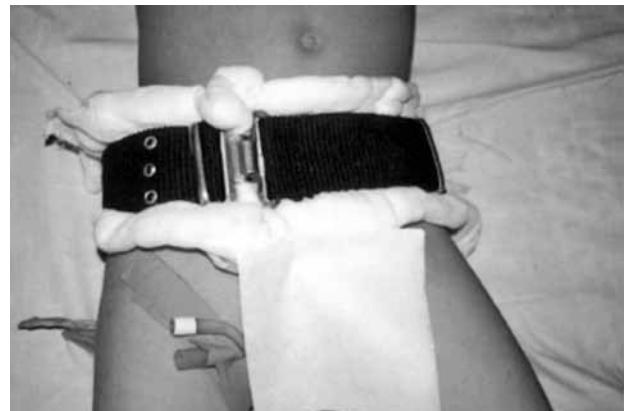
Şekil 1. Palaska uygulaması.

Standart eksternal fiksator uygulamaları vertikal yönde stabil olmayan kırıklarda posteriyor sakroiliyak