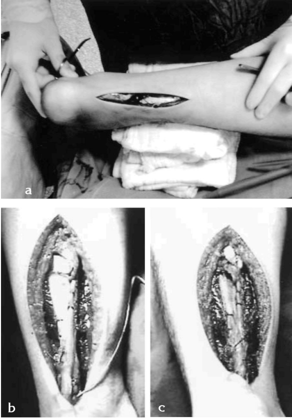
Şekil 3 a,b,c: Akut aşil tendon yırtığı nedeniyle opere edilen orta-yaşlı bir erkek hasta. a: Tendona göre medial yerleşimli longitudinal cilt kesisi ve bunu takip eden fasya kesileri sonrası tendondaki total yırtık tam olarak ortaya kondu; b: Bu yırtığın tedavisinde, Krackow (locking-loop) dikiş tekniğiyle primer uç-uca tamir uygulandı; c: Tamir, plantaris tendonu ile takviye edildi.

edilmelidirler. Açık tamir istemeyen hastalarda, muhtemelen kozmetik sebepler veya açık tamirin daha büyük bir operasyon olduğunu düşünmeleri nedeniyle, perkütan tamir düşünülmelidir. Konservatif tedavi ise operatif tedaviden belirgin bir fayda sağlaması beklenmeyen, yaşlı hastalar için saklanmalıdır.