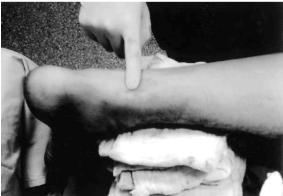
Şekil 2: Akut aşıl tendon yırtığı sonrası, tendonun yırtılma bölgesinde boşluk (gap) oluşumu ve ayak bilek çevresinde ekimoz gelişimi görülmektedir.

Klinik semptomlar ve fizik muayene bulguları, aşıl tendon yırtıklarının tanısının konmasında genellikle yeterlidir. Nadiren, özellikle geç tanı almış uzun süreli vakalarda, yardımcı radyolojik tetkiklere ihtiyaç duyulabilir. Geçmişte, aşıl tendon yırtıklarının indirekt olarak görüntülenmesinde radyografilerden faydalanılmıştır, fakat bu tekniğin günümüzde artık