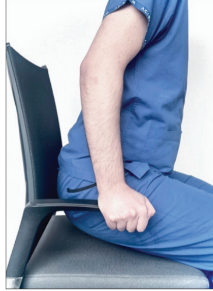
Şekil 2. Chair push-up test.

olur. [26] Kişi kendi vücudunu koltuğun kolçaklarından tutup kaldırmaya çalıştığında da aynı bulgu ortaya çıkar. [26] (Şekil 2) Radius başı sabitlendiğinde subluksasyonun ve endişenin kaybolduğu görülür.