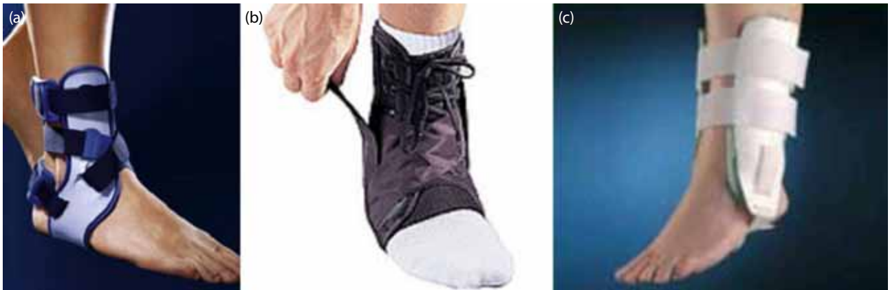
Şekil 8. (a) Semi-rijid bileklik. (b) Bağcıklı ayak bilekliği. (c) Aircast.

Bazı yazarlar bantlama ve bileklik kullanımının, koordinasyon eğitimi bitene kadar ve yaralanma riskinin daha fazla olduğu durumlarda (örn: hasta sportif aktivitelerde yorulduğunda, yüksek riskli spor aktivitelerine katıldığında ya da bir tekrarlama yaşadığında) faydalı olduğunu bildirmişlerdir. [69-71,73,74,81] Yeni yapılan eleştirel bir derlemenin sonuçlarına göre, ayakkabı tipinin ayak bileği burkulma riski üzerine olan etkisi literatürde sadece dört çalışma ile incelenmiş ve sonucunda bu etkinin spekülatif olduğuna karar verilmiştir. [8] Direkt olarak ayakkabı şeklinin ayakkabı burkulma insidansı üzerine olan etkisi incelendiğinde, ayakkabı şekli ile yaralanma riski arasında hiç bir anlamlı ilişki bulunamamıştır. [89] Ayrıca ayakkabı topunun da etkili olduğundan söz edilmiş; ancak ayakkabının, bantlama veya bileklik ile birlikte kullanılması nedeni ile sonuçlar çelişkili bulunmuştur. [8] Bantlama ve bilekliğin devamlı kullanımının, proprioepsiyon üzerine olan etkisi çok iyi bilinmemekle birlikte, uzun dönemde fonksiyonel stabilite üzerinde muhtemelen negatif etkisinin olduğu bilinmektedir. Bu nedenle fonksiyonel stabilitenin sağlanması, tedavinin son noktası olmalıdır ve sonrasında eksternal destek aşamalı olarak azaltılmalıdır.