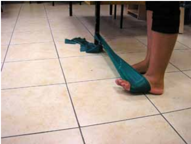
Şekil 3. Terrabandlar ile evertör kuvvetlendirme.

Akut ayak bileği yaralanması ile genellikle proprioseptif sinir lifleri veya reseptörler de yaralanır.