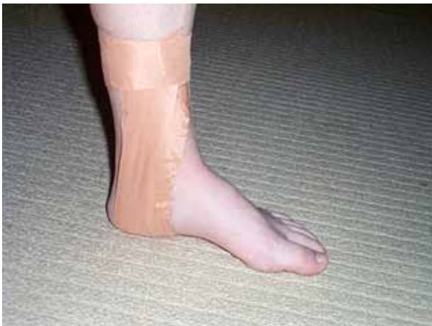
Şekil 7. Bantlama.

Kronik ayak bileği instabilitesi olan hastalarda bantlamanın, gerçek ve algısal dinamik postural stabilite üzerine olan etkisi de bazı çalışmalarla incelenmiştir. Çalışmanın sonucunda, bantlamanın dinamik postural stabilite üzerine anlamlı bir etkisinin olmadığı, ancak hastaların güven, stabilite ve endişe ile ilgili algılarında önemli gelişmeler olduğu görülmüştür. [83-85]