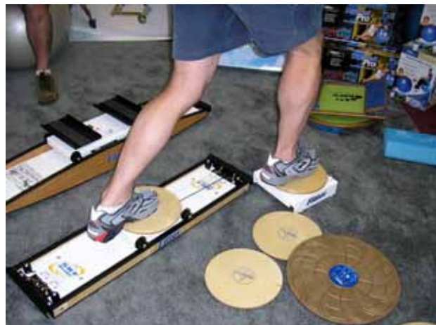
Şekil 5. Profitter ile farklı yönlerde denge eğitimini içeren proprioseptif egzersizler.