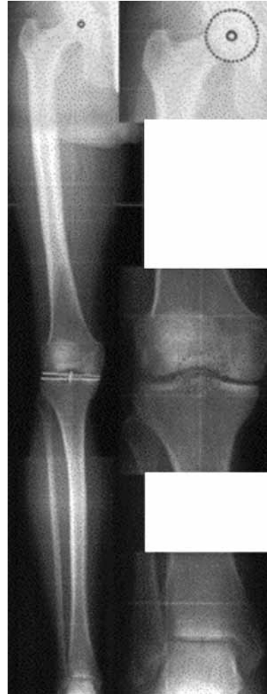
Şekil 2. Radyografik olarak alt ekstremiten dizilimi.

Özet olarak, gonartroz genellikle tek kompartmandan başlar, çoğunlukla mekanik aksın mediale