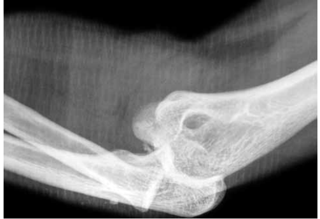
Şekil 2. Aynı taraf fizik muayene ile saptanan dirsek eklemi şekil bozukluğunun dirsek eklemi kırıklı çıkığı nedeni ile olduğu görülmektedir. Koronoid çıkıntıda tip I kırık mevcuttur.

Kırığın oluş mekanizmasının anlaşılabilmesi için hastanın öyküsünün dikkatli bir şekilde alınması önemlidir. Öykü alınırken kırığın oluşumuna neden olan spor etkinliğinin hastanın günlük yaşamındaki anlamı kısaca sorgulanmalıdır. Yaşamını kırığın oluşumuna neden olan spor etkinliği ile idame ettiren profesyonel bir sporcu ile adı geçen sportif aktiviteyi nadiren uygulayan bir kişi arasında, ortopedik cerrahın tedavi seçeneklerine yaklaşımı farklı olabilir. Daha sonra hızlı, fakat sistem içeren bir şekilde kırığın bulunduğu üst ekstremitenin fizik muayenesi yapılmalıdır. Aynı ekstremitte üzerinde yer alan ağırlı veya şekil bozukluğu içeren bölge ve eklemlere dikkat ve özen gösterilmelidir (Şekil 1, 2). Kısa fakat özenli bir nörovasküler muayene daha sonra oluşabilecek komplikasyonların önlenmesinde büyük önem taşır (Şekil 3).