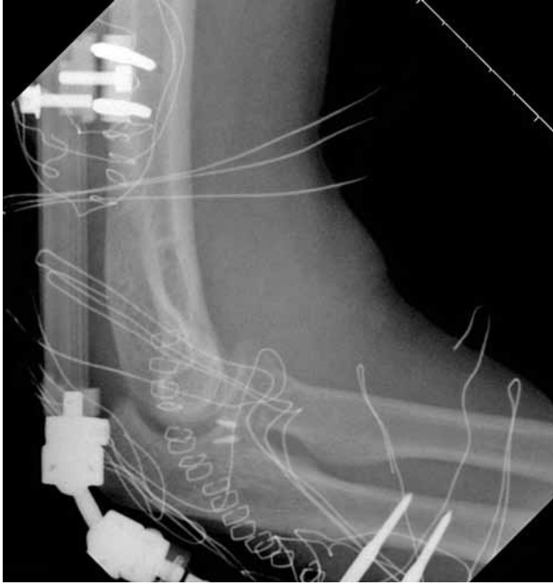
Şekil 7. Cerrahi tedavi sonrası görünüm. Kemik çıpalar ile bağ tamiri uygulanmış, stabil eklem hareket açıklığının 40 dereceden az olduğunun gözlenmesi üzerine yumuşak doku iyileşmesi süresinde tamiri korumak amacı ile eksternal fiksator ile stabilizasyon uygulanmıştır.

oluşturmaktadır. Çocukluk çağında spor etkinliği sonrası fizis yaralanması gerçekleştiğinde, Salter-Harris tip I ve II kırıklar için çoğunlukla immobilizasyon ve alçılama, Salter-Harris ayrılmış tip II ve tip III-IV kırıklarda ise redüksiyon manevraları ve cerrahi tedavi gerekmektedir. [17]