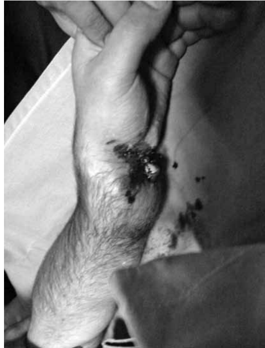
Şekil 3. El bilek eklemi volar yüz incelendiğinde ise, ulna distal eklem yüzünün gözlemlendiği açık yaralanma saptanmıştır. Yaralanmanın distalinde el parmaklarında dolaşımın mevcut olmadığı gözlenmektedir.

Radius distal uç kırıklarının radyolojik değerlendirilmesinde, dirsek ve omuz eklemi 90 derecede ve önkol nötralde iken posteroanterior (PA) grafi çekilir (Şekil 4). Daha sonra röntgen cihazı distalden proksimale 20 derece eğimli pozisyonda iken lateral grafi çekilmelidir. [14] Bilgisayarlı tomografi (BT), parçalı eklem içi kırıklarda cerrahi tedavi yöntemi planlanırken sıklıkla başvurulmuş bir görüntüleme