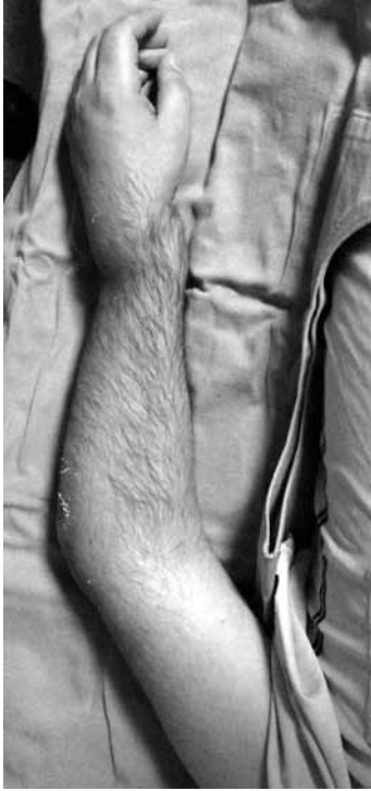
Şekil 1. Otuz iki yaşında erkek hasta. Sol üst ekstremitte üzerine düşme öyküsü ile acil servise başvuran hastada aynı taraf muayenesinde belirgin el bileği ve dirsek eklemi şekil bozukluğu gözlenmektedir.

sınıflamasının veya tanımlanmış diğer sınıflamalardan birinin kullanılması, tanı ve tedavinin sağlıklı yapılabilmesi için mantıklı bir yol oluşturmaktadır.