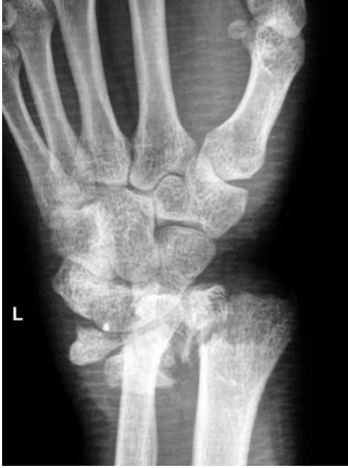
Şekil 4. Radyolojik inceleme ile AO tip 3C radius distal uç kırığı gözlenmektedir. Ulna distalinde, radyoulnar eklem komşuluğunu oluşturan ulnar kemik parçasının da ayrıldığı saptanmıştır.