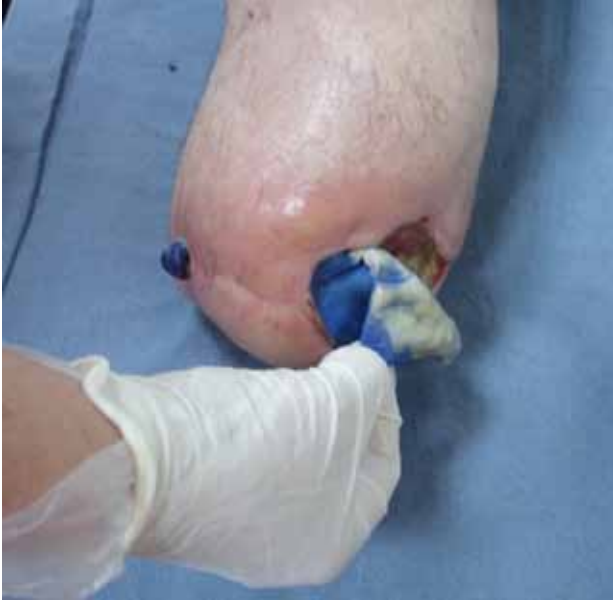
Şekil 6. Metilen mavisi içerikli köpük örtü uygulaması. Eksuda ile temas eden yara örtüsünde renk değişikliği oluşur.