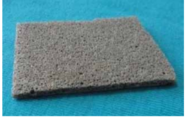
Şekil 3. Gümüşlü köpük örtü.

yaralarda kullanılabilir. Antibakteriyel özelliği azdır, enfekte yaralarda önerilmez. Eksudası fazla olan granülasyon ya da epitelizasyon aşamasındaki yaralar için uygundur. Yumuşak yapıda olduklarından ve piyasada iplik ya da şerit formları da bulunabildiğinden, kaviteli, dar yaralara da uygulanabilir. [2] Jelleştikleri için, yara-dan kaldırılmaları kolay ve ağrısızdır. Genel olarak 3-5 günde değiştirilmesi önerilse de, örtü sıvıya doyduğunda yenilenmelidir.