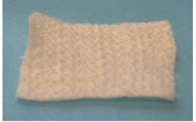
Şekil 1. Aljinat yara örtüsü.

Bunlar, genellikle transparan olan, poliüretan yapıda ve yarı geçirgen malzemelerdir. Bir film örtü, gaz, nem ve buharı geçirir, ancak sıvıya geçirgen değildir. Bu sayede, yaranın nemli tutulmasını sağlar. Ancak, absorpsiyon özelliği yoktur. Az eksudalı ya da eksudasız yüzeysel yaralarda kullanılması uygundur. Sızdırmazlık çift yönlü olduğundan, yaranın dışarıdan ıslanmasını da engeller; dolayısıyla, hasta banyo yapabilir. Bakteriyel kontaminasyon için mekanik bir engel oluşturur. Bazen kuru nekrozun yumuşatılarak uzaklaştırılması için de kullanılır. Bir diğer kullanımı da, diğer örtülerin jel ya da dolgu malzemelerinin yaraya sabitlenmesi içindir. Yarada uzun süre kalmaları uygun değildir; diğer örtülere göre daha sık pansuman değişimi önerilir. Ayrıca, bir yanı adhesif ile kaplıdır; sağlam deride alerjik reaksiyon riski vardır. [4] Film örtüler, pratikte tedaviden çok koruyucu amaçla kullanılmaktadır.