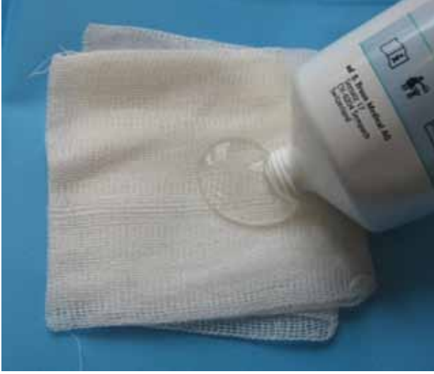
Şekil 4. Hidrojel.

sudur. Yarayı nemlendirmek ve daha çok nekrotik yaraların otolitik debridmanı için kullanılır. Absorpsiyon özellikleri çok azdır. Antimikrobiyal özellikleri ise yoktur. Dolayısıyla, yüzeysel, enfekte olmayan ve eksudasız yaralarda kullanımı önerilir. En önemli dezavantajı, film örtü gibi ikinci bir yara örtüsü gerektirmesidir. Pansuman değişiminin günlük yapılması daha uygundur. [15]