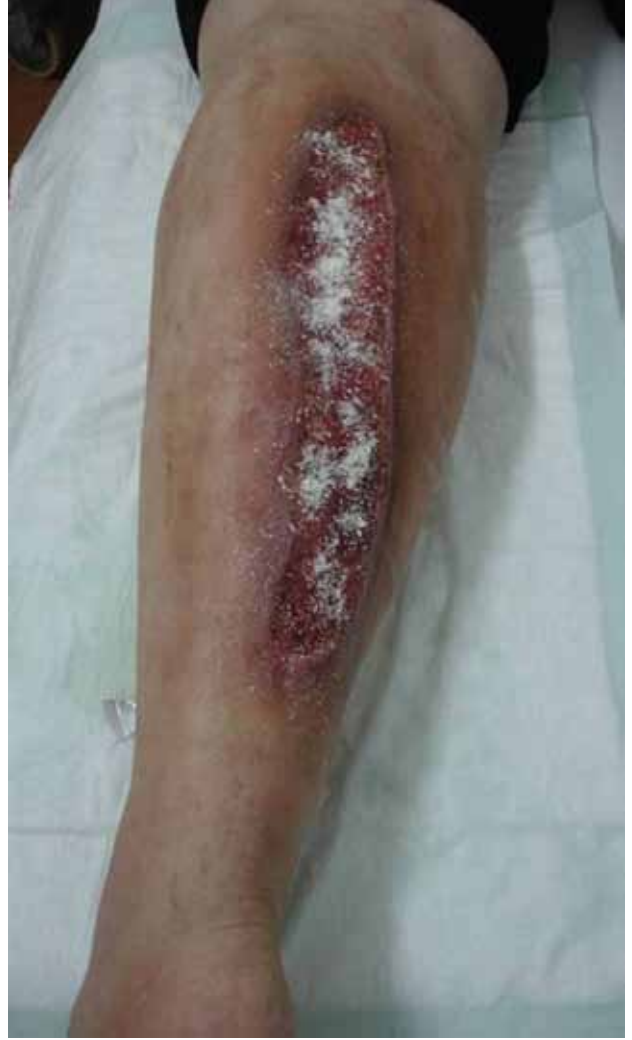
Şekil 5. Yaraya toz kollajen uygulaması.

Kollajen, bağ dokusunun yapı taşıdır ve vücutta yirmiye yakın türü vardır. Bunlardan özellikle ikisi, Tip 1 ve Tip 3, yara iyileşmesinin çeşitli aşamalarında görev alır. Ayrıca, yara iyileşmesini bozan matriks metalloproteinazları bağlayarak da iyileşmeye katkı sağladığı yönünde bulgular vardır. Kollajenli örtüler ise, at, sığır, tavuk gibi hayvanlardan elde edilen Tip 1 kollajenden üretilmektedir. Absorpsiyon özelliği yüksektir; ağırlığının 10 katına kadar eksudayı tutabilir. Antimikrobiyal etkinliği ve debridman özelliği yoktur. Eksudalı, enfekte olmayan yaralar için kullanılabilir. Şekli kolay değiştirilebilir olduğundan, her türlü yaraya kolaylıkla